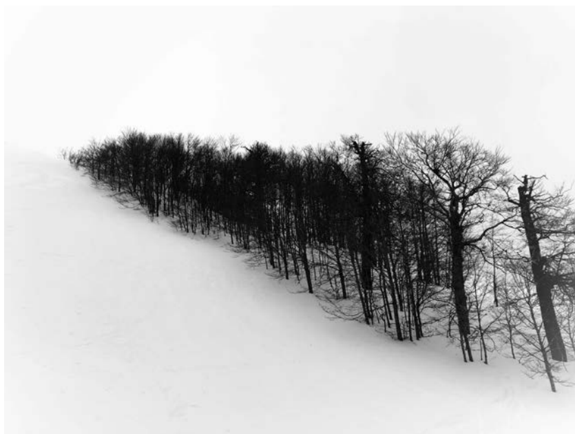
Filena Fortinguerra. Non so dove sono stato con te.