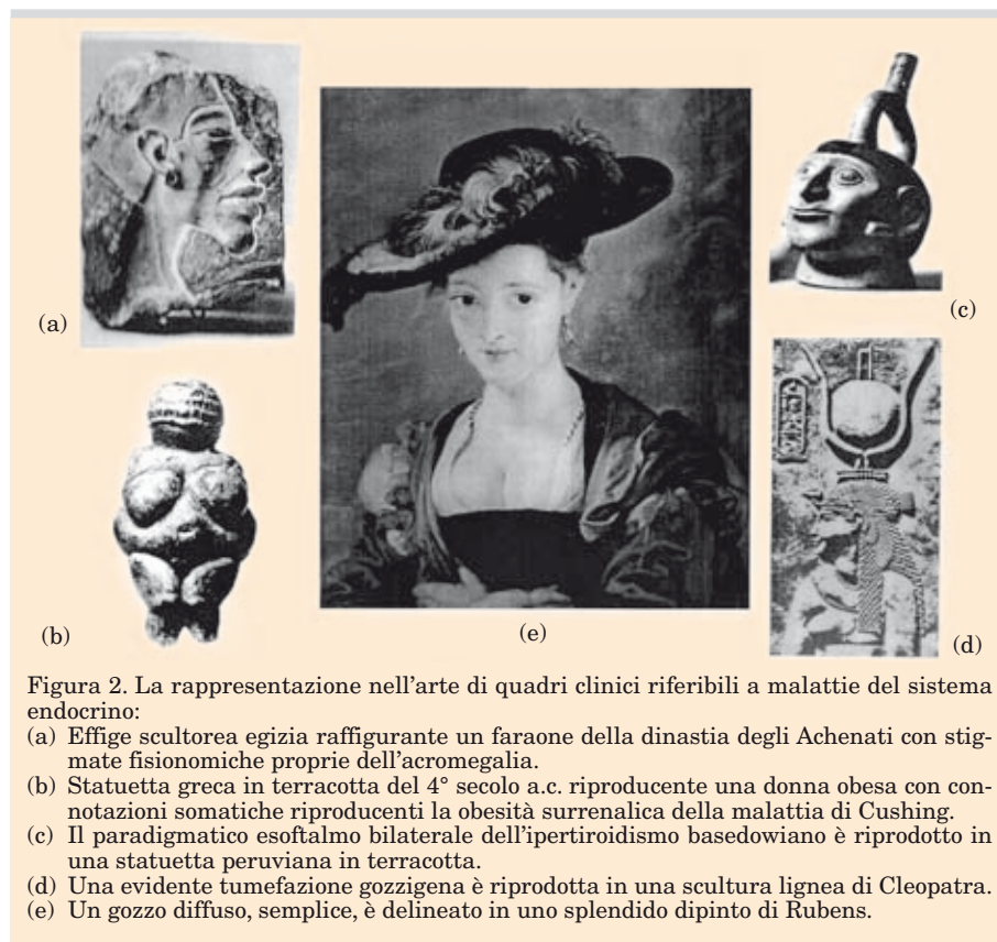
Figura 2. La rappresentazione nell'arte di quadri clinici riferibili a malattie del sistema endocrino:

Plummer introdusse, nel 1923, la somministrazione profilattica dello iodio quale efficace misura preventiva della "crisi tireotossica" intraoperatoria, ad espressione cardio-aritmizzante 15 . Egli, sulla base della teoria che ipotizzava la produzione, da parte della ghiandola iperfunzionante, di una molecola ormonale anomala, ritenne che in tali condizioni tachiaritmiche si producesse una molecola tiroxinica non completamente iodurata.