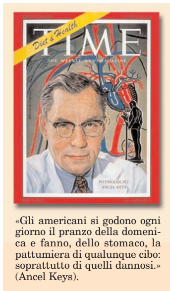
«Gli americani si godono ogni giorno il pranzo della domenica e fanno, dello stomaco, la pattumiera di qualunque cibo: soprattutto di quelli dannosi.» (Ancel Keys).

dieta contribuisca a calmierare la patologia coronarica. Questa serie di intuizioni, convergenze, correlazioni fu alla base del convegno nell'Istituto di Fisiologia di Napoli, allora situato nel bel chiostro di S. Andrea delle Dame, che Keys – con la collaborazione di Gino Bergamini e di Flaminio Fidanza – organizzò per studiosi di ogni parte del mondo, a verifica della sua ipotesi sulla prevenzione dell'infarto miocardico. E fu da lì che prese avvio il famoso "Studio dei Sette Paesi". Tornato negli Stati Uniti a tarda età, vi morì nel 2004, all'età di 100 anni, dopo esser stato insignito dal Presidente della Repubblica Italiana di Medaglia d'argento al merito per la salute pubblica.