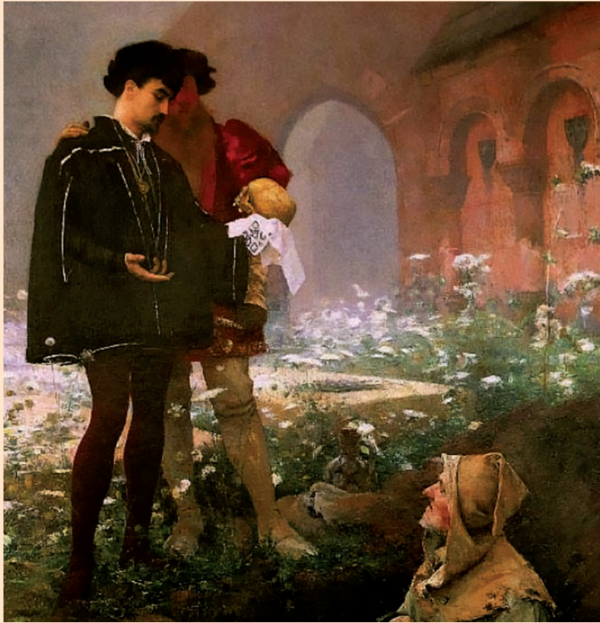
Pascal-Adolphe Dagnan-Bouveret: Amleto ed il becchino (part.), 1883. Emulo del Bardo di Avon, Roth ci offre il paesaggio della sofferenza irredimibile, l'immagine del locus senza ritorno in cui si immerge l'umana vulnerabilità, fino al brivido estremo: il rumor sordo della pietra che ci nega alla luce della vita.

e, non ultimo, dalla presenza dell'idea della morte... dalla storia dei suoi modi di sentire, valutare, tendere e volere, dalla densità dei suoi incontri esistenziali (la "innere Lebensgeschichte" di Ludwig Binswanger). È così che, al posto del tempo che scorre (la pesante tirannia del calendario), entra potente il tempo del mondo , e la vecchiaia può essere anche maturazione, creatività.» (Bruno Callieri: Corpo Esistenze Mondie . Edizioni Universitarie Romane, Roma 2007: pagg 93 e segg. [I corsivi sono dell'Autore]). Qui, la consonanza radicale con l'elegia rothiana sublima la rabadomantica autocelebrazione esequiale in eros di alto lignaggio: «un eros che, non avendo più scopi, potrebbe capire l'amore fine a se stesso, non più fugace abbraccio, ma trasalimento»: messaggio, peraltro, felicemente suggerito, fin dal titolo ("Lust and Death"), nella lusinghiera recensione del libro apparsa sul New York Times a firma di Nadine Gordimer.