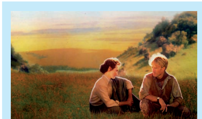
La mia Africa (1985), di Sidney Pollack

Finalmente arriva un meritato tributo a misconosciuti eroi dello schermo. Attori, registi, produttori ottengono, da anni, statuette, medaglie, diplomi, mentre nessun applauso aveva finora gratificato il ruolo cinematografico dei farmaci antibatterici. Benvenuto, dunque, un recente studio – dal Dipartimento di Medicina Preventiva dell'Università di Salamanca - che ha individuato una settantina di film in cui essi, gli antibatterici, hanno un ruolo di protagonisti o quasi. ( Revista Española de Quimioterapia 2006; 19: 397-402 ). La maggior parte di tali film sono della seconda metà del Novecento, ma precursore fu uno del 1940 – "Dr. Ehrlich's Magic Bullet" – che, dati i tempi, non ebbe una versione italiana. Era una biografia di Paul Ehrlich, scopritore dell'arsfenamina, che – nel lontano primo decennio del secolo scorso – fu commercializzata come antiluetico col nome di Salvarsan. E questo farmaco ha tenuto banco per anni, in numerosi film: "La mia Africa", di Sidney Pollack (1985),