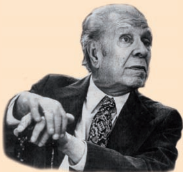
Jorge Luis Borges

Gli autori sottolineano infine che i risultati da loro raccolti non possono essere estrapolati a oltre 5 anni, poiché l'effetto dell'iperglicemia sulla progressione dell'arteriosclerosi può manifestarsi anche dopo molti anni.