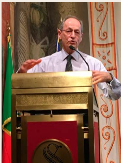
Sir Michael Marmot durante il suo intervento al convegno “Disuguaglianze di salute: quanto pesano? Si possono modificare?”, promosso dalla Commissione Sanità del Senato, 24 gennaio 2017.

Per concludere, scrive Rodolfo Saracci nella Presentazione dell'edizione italiana: «Come gli ampi squarci autobiografici del libro dimostrano, la singolarità di Michael Marmot, che ne fa una figura di primissimo piano della medicina e sanità pubblica britanniche e internazionali, sta nella sua semplicità disarmante: la motivazione del medico, mantenere in salute i propri simili, chiunque e tutti, si estende coerentemente e senza soluzioni di continuità dalla fase clinica alla prevenzione individuale e quindi alla prevenzione collettiva delle “cause (sociali) delle cause (materiali)” delle patologie. Viene così recuperata alla medicina d'oggi, troppo immersa di fatto e al di là delle intenzioni nei propri successi tecnologici, il primitivo senso “rivoluzionario” del citatissimo detto del giovane Virchow («La medicina è una scienza sociale, e la politica non è nulla di più che medicina su larga scala»), cui Virchow aveva premesso una frase essenziale, quasi mai citata, che ne sostiene la logica appoggian-