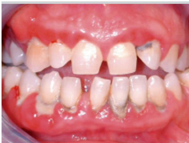
Figura 2. Parodontite cronica generalizzata severa.

Tuttavia, l'attenzione riguardo le implicazioni sistemiche delle infezioni è aumentata nell'ultimo decennio. Studi sierologico-epidemiologici hanno sostenuto l'associazione tra aterosclerosi, eventi cardiovascolari ed alcuni comuni patogeni ( Chlamydia pneumoniae , Helicobacter pylori , Escherichia coli , Cytomegalovirus ) 41-46 . Tuttavia, studi prospettici non sono riusciti a confermarla 47, 48 .