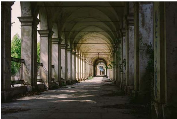
«Nel manicomio il malato non trova altro che il luogo dove sarà definitivamente perduto»

La sede del DSM, di cui Zanalda è direttore, si trova all’interno del parco dell’ex manicomio di Collegno, oggi intitolato al Generale Dalla Chiesa. Era l’ospedale psichiatrico più grande d’Italia e sicuramente il più famoso in Piemonte. Nel giugno 1977 Collegno si riappropriò del suo manicomio, abbattendone il muro di cinta. L’immagine del sindaco di allora, Luciano Manzi, che scavalca le macerie per entrare all’interno divenne un’icona. L’ospedale psichiatrico chiuse poi nel 1982, continuando a ospitare un piccolo nucleo di pazienti fino al 1997. Il comune di Collegno decise, quindi, di trasformare un luogo di sofferenze, crudeltà, oppressione, in una realtà cittadina dedicata alla cultura, al tempo libero, all’istruzione.