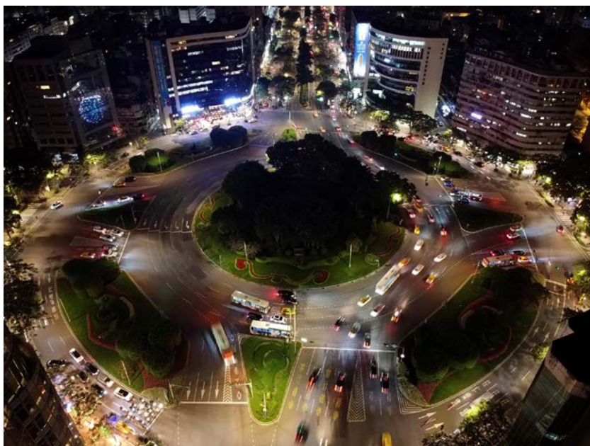
Taipei, di MiNe (Flickr CC).

Un altro esempio? Quello dell'osteopatia, "scienza" o "tecnica" di cui si è parlato nelle scorse settimane, dopo che un noto giornalista aveva detto che l'ictus da lui sofferto era probabilmente dovuto a un'improvvisa