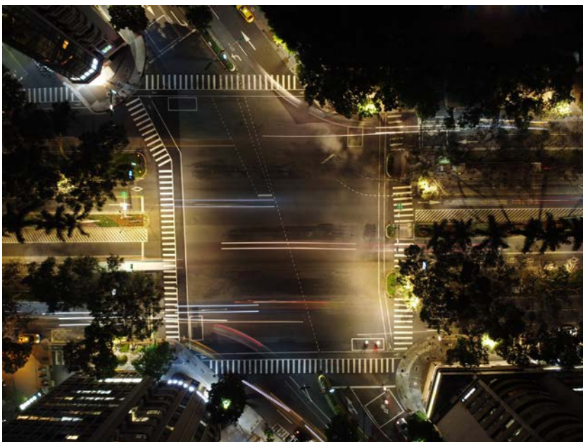
Taipei, di MiNe (Flickr CC).