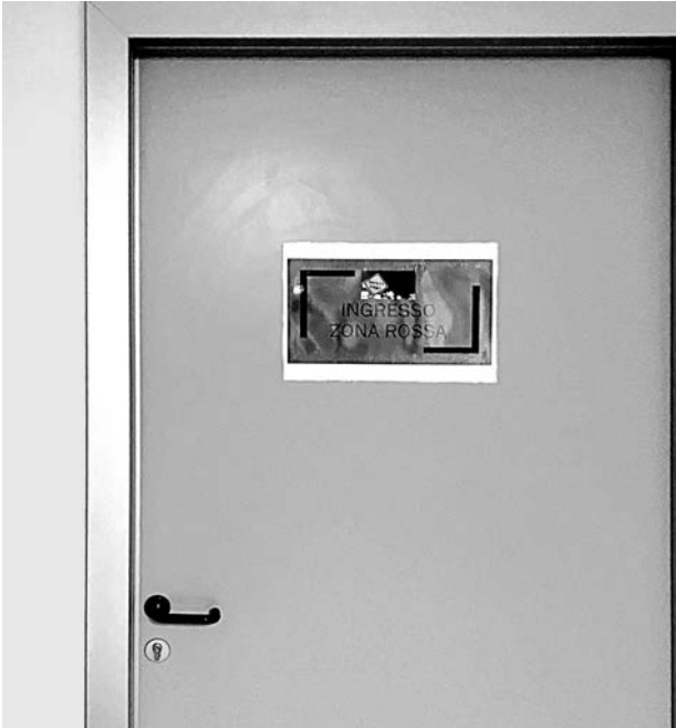
Foto 3. Porta d'accesso alla zona rossa.

mente apriamo, sulla base della conta dei DPI ci danno indicazioni a ricoverare 3 pazienti. Entro sera ne arrivano 7. In due giorni il reparto, ristrutturato per ospitare 10 pazienti, ne accoglie 14, uno in più dell'era pre-CoViD. I monitoraggi che ci hanno promesso per i 4 letti rimanenti non arriveranno mai. Ci aggiustiamo recuperando qualche monitor portatile dal PS e una colonnina parametri che abbiamo sempre avuto in reparto, ma un letto rimane completamente sguarnito.