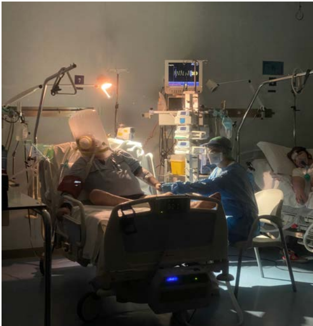
Foto 6. Stanza di isolamento per CoViD-19.