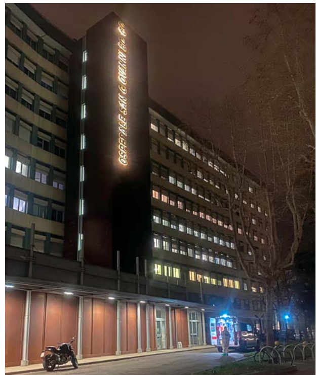
Foto 5. L'Ospedale di notte.

Tutto l'ospedale ci sta dando una mano. Cento letti di medicina interna sono stati convertiti in posti CoViD a bassa intensità, la chirurgia generale è diventa-