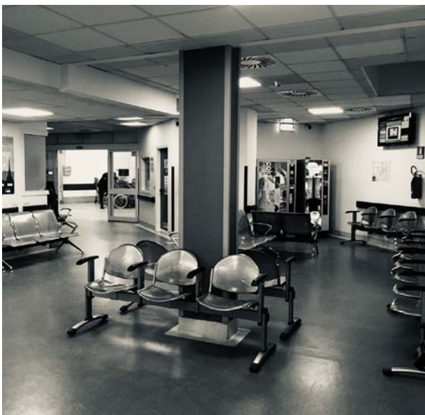
Foto 1. La sala d'aspetto del pronto soccorso.