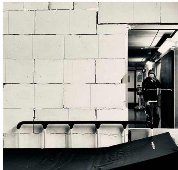
Foto 2. The Wall, il muro tra il reparto CoViD e il resto dell'ospedale.