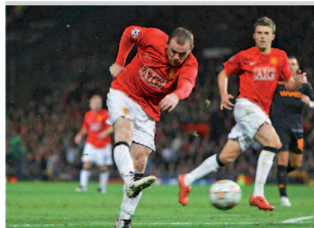
Figura 2. "Who are the BMJ's competitors?" Scriveva il direttore Richard Smith sul BMJ: "They also include Manchester United, Hollywood films, digital television, computer games, and a walk in the park."

Le riviste, oggi, sono tutte sul web, pur avendo scelto modalità non omogenee. Quasi sempre sono offerte agli utenti le opportunità più classiche – editorialmente parlando – che vanno dalla possibilità di ottenere fascicoli ed annate pregresse alla proposta di raccolte omogenee di articoli, fino alla possibilità di ricerca libera o avanzata all'interno dei contenuti di singoli testi.