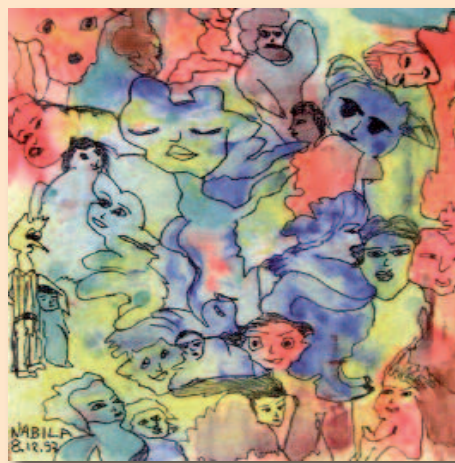
Nabila: "Senza titolo", acrilico su tela, cm. 63,5 x 53,7, 1997.

Perché "Follia gentile"? Il libro lo spiega in poche righe: è una provocazione a riflettere sul modo di essere e di vivere di intere società. Si legge nell'introduzione: «Siamo davvero certi che nello strapotere mediatico di veline e calciatori, in una politica fatta di delega senza partecipazione, in uno stato dove ancora la mafia detta leggi e tangenti, nel liberismo esasperato e nel dominio dell'economia sulle relazioni, nell'individualismo con cui ci mettiamo in contatto con una chat in Giappone ignorando il nome del nostro dirimpettaio, siamo certi davvero che in tutto ciò non si possa ravvisare lo stesso germe di follia di chi guarda una nuvola e ne sente la voce? Per questa ragione abbiamo lanciato la provocazione della definizione "Follia gentile": nell'accostamento di questi due termini stanno probabilmente tutta la dialettica e il conflitto tra cosiddette normalità e follia della nostra società e della nostra esperienza di individui.»