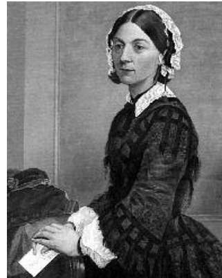
Florence Nightingale (1820-1910): è considerata la fondatrice dell'assistenza infermieristica. Durante la guerra di Crimea (1854-56) organizzò i servizi sanitari dell'esercito britannico.

È una doviziosa esposizione di pareri sul perché, ancora oggi, negli Stati Uniti persista un incongruo "gender gap" nella corporazione medica. Tuttavia, la situazione sta migliorando e il divario fra medici maschi e medici donne sta diminuendo sia relativamente al numero, sia per quanto riguarda funzioni e gerarchie. Una spiegazione "riduzionista" di tale incremento femminile nelle Facoltà di medicina lo riconduce nell'ambito del pregiudizio maschilista: la causa, sarebbe, cioè, un ipotetico deterioramento generale della professione, che ve-