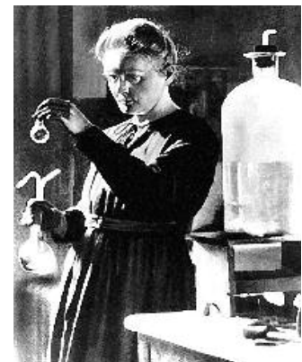
Marie Skłodowska Curie (1867-1934). Premio Nobel 1903 (insieme al marito Pierre Curie) e Premio Nobel 1911 (da sola).

D'altra parte, non è possibile ignorare alcune circostanze - biologiche e biografiche - che possono condizionare le scelte delle carriere femminili: non più tanto barriere dovute a impari opportunità o a discriminazioni pregiudiziali, bensì esigenze familiari, minore disponibilità al lavoro extraorinario, maggiore inclinazione - per quanto riguarda la professione medica - ad aree particolari quali pediatria, microbiologia, neuropsichiatria infantile, genetica ed ostetricia. Però, come sopra accennato, la situazione sta cambiando. Uno studio recentemente apparso sul BMJ ci dice che tra una decina di anni avremo una maggioranza di dottoresse.